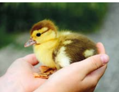
Диазинон чрезвычайно токсичен для домашней утки

Накопление негидролизованного ацетилхолина вызывает тремор, переходящий в паралич. Диазинон относится ко второму и третьему классам опасности для человека (в зависимости от формы использования). При исследовании диазинона установлены следующие величины полулетальной дозы LD_{50} (вызывает гибель 50% исследуемой группы): для крыс — 300–850 мг/кг массы тела, мышей — 80–135 мг, морских свинок — 250–355 мг, свиней — 100 мг/кг, при пероральном пути поступления в организм. Однако для некоторых видов животных диазинон обладает чрезвычайной токсичностью. Это прежде всего пчелы, рыбы и птицы. LD_{50} для птиц при оральном пути попадания диазинона в организм составляет 3,5 мг/кг массы тела, для диких уток — до 1,44 мг, для кур — 8 мг, для фазанов — 3 мг/кг. По данным Агентства по защите окружающей среды США, диазинон стоит на втором месте в списке причин массовой гибели птиц от пестицидов, уступая только карбофурану (хотя следует учесть, что речь идет исключительно о зарегистрированных случаях).