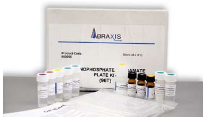
Рис. 2. Тест-система Abraxis OP /Carbamate

Диазинон определяют хроматографически (с масс-спектрометрическим детектором). Однако данная методика требует наличия сложного и дорогого оборудования, квалифицированного персонала, а также временных затрат. Тем не менее предприятиям, производящим корма, требуется оперативная информация о содержании диазинона и других ФОС в сырье. Необходим инструмент для экспресс-определения органофосфатов.