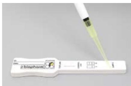
Рис. 1. Иммунохроматографическая тест-полоска Rida®Quick Aflatoxin

Рис. 2. Визуальная оценка результатов анализа с помощью тест-полосок Rida®Quick Aflatoxin