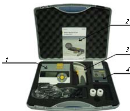
1 — ридер Rida®Quick Scan, 2 — инструкция; 3 — сканер для считывания штрих-кода; 4 — принтер

синов в пробе. Для этого необходим портативный ридер Rida®Quick Scan (рис. 3). Дополнительно к ридеру могут поставляться сканер для считывания QR-кода с упаковки тест-полоски и принтер для распечатки результатов. Весь комплект оборудования