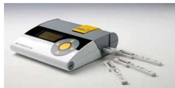
Рис. 3. Ридер-денсиметр Rida®Quick Scan