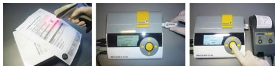
Считайте QR-код с калибровкой

Ридер Rida®Quick Scan позволяет автоматизировать процесс анализа и протоколирование результатов. Ридер сохраняет до 20 профилей пользователей, то есть можно дифференцированно хранить и просматривать результаты 20 разных операторов. Питание обеспечивается от сети или аккумулятора. Ридер поддерживает USB-соединение с персональным компьютером для передачи данных, что позволяет оптимизировать